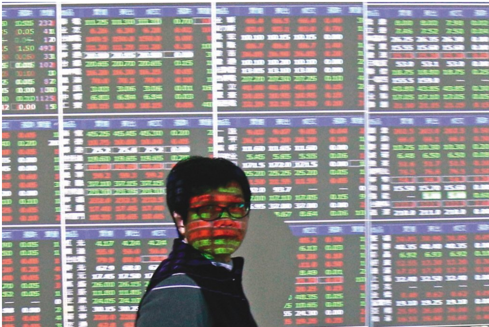
大家普遍誤解企業經營只追求股東權益或只在意利潤。

其實，大家普遍誤解企業經營只追求股東權益或只在意利潤。從實務運作，當公司滿足客戶的需求而有營業收入時，要先支付人工成本、原料成本、製造費用、管銷費用，也就是員工、供應商，以及公司有業務往來者皆先獲得報償。其次，要支付利息費用、員工教育訓練費用與投入環境保護費用，亦即債權人拿到償付、提升員工人力資本，以及維護公司所在之社區大眾的權益。再者，有獲利須繳納公司所得稅，政府也拿到償付，此乃公司對社會公益的貢獻。